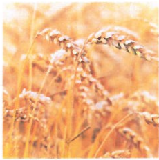
żółty – pachnące chlebem pola