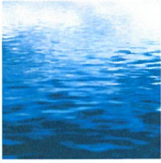
niebieski – woda, rzeki: Wierzyca i Wda