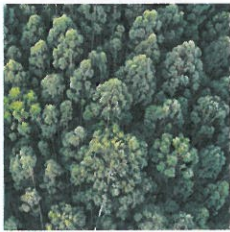
zielony – kociewskie lasy, Bory